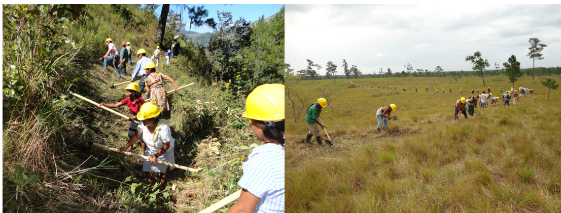
Comunidades de Agua Fría, El Paraíso y Auka, La Mosquitia realizando actividades de protección forestal.

Con la aprobación del Plan de Manejo Forestal y el respectivo Plan Operativo Anual, la organización comunitaria puede iniciar las actividades forestales. Los productores están obligados a cumplir estrictamente con las metas establecidas en el Plan Operativo Anual. Las actividades abarcan además del aprovechamiento forestal medidas de protección, prevención de incendios forestales, mejora del bosque remanente a través de reforestación o plantaciones de enriquecimiento con plántulas producidas en viveros, raleos y la liberación de espacio de árboles de valor. También se realizan actividades de mantenimiento de caminos y medidas para minimizar la erosión del suelo.