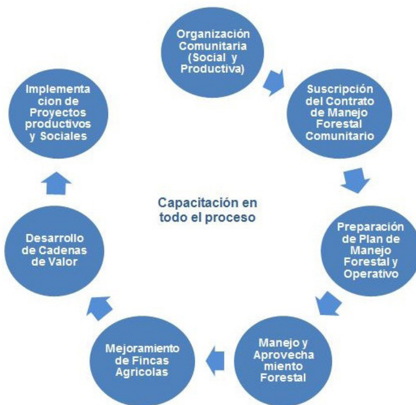
Gráfico 3: Etapas principales en el proceso de Forestería Comunitaria

En el contexto de las etapas principales del proceso (Gráfico 3), se identifican 12 pasos operativos para el desarrollo progresivo de la Forestería Comunitaria: