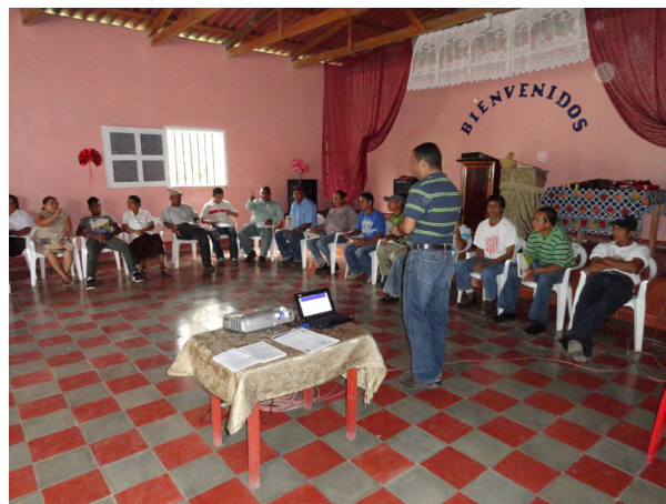
Capacitación a comunidad de la Cooperativa El Salitre, El Rosario, Olancho.

El desarrollo de capacidades es un aspecto esencial en el proceso de Forestería Comunitaria. La capacitación a las organizaciones comunitarias debe comprender diversos campos como: gestión organizativa, administración, contabilidad básica, protección y manejo integral del bosque, transformación, comercialización, mejoramiento de parcelas agrícolas y gestión de proyectos de desarrollo comunitario. Estas capacitaciones deben realizarse oportunamente en cada etapa del proceso bajo la responsabilidad del personal técnico del ICF, ocasionalmente apoyado por aliados especializados en la materia. Es importante implementar un plan de capacitación continuo, ya que en el proceso se realizan cambios frecuentes en las directivas de las organizaciones productivas y consejos intercomunales.