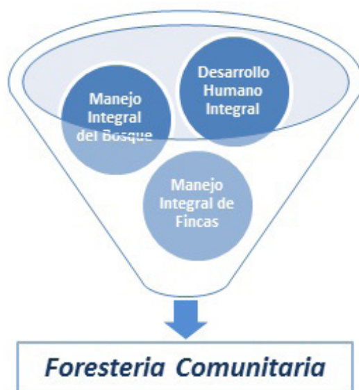
Gráfico 1: Ejes Estratégicos de la Forestería Comunitaria

3) Manejo Integral de Fincas: Asociado al manejo responsable del bosque, se impulsa la diversificación y el mejoramiento de la unidad de producción agrícola a fin de aumentar la disponibilidad de alimentos y generar excedentes para incrementar el ingreso familiar. El mejoramiento de la unidad productiva se logra mediante un cambio en la cultura de la agricultura de subsistencia.