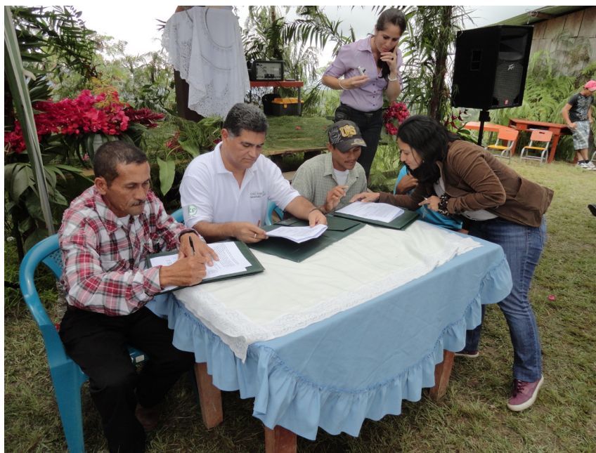
El Ministro del ICF Ing. Trinidad Suazo suscribiendo el Contrato de Manejo Forestal Comunitario con los Directivos de la Cooperativa San José de los Guares, Yoro.

Una vez inscrita en el registro del Sistema Social Forestal, la organización (cooperativa o asociación productiva) suscribe con el ICF un Contrato de Manejo Forestal Comunitario, por cinco años prorrogable a 40 años, sobre un área de bosque de tenencia nacional. Previamente se realiza una revisión del área seleccionada en el campo y su georeferenciación en un mapa, se procede a publicar en al menos dos medios de comunicación la potencial asignación del área. Simultáneamente, se prepara una propuesta de contrato de manejo forestal comunitario, la cual se socializa con la organización comunitaria para acordar los términos y se procede a la firma por la autoridad superior del ICF y los directivos representantes de la comunidad.