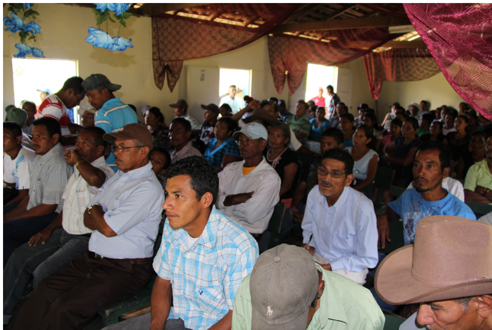
Asamblea comunitaria para la organización de la cooperativa El Encino, Esquipulas del Norte, Olancho.

Una vez que las comunidades hayan manifestado su interés, se les brinda apoyo para organizarse como cooperativas forestales u otra modalidad de asociación (organización productiva) donde están representadas todas las comunidades; para ello deben gestionar su personería jurídica a fin de que sean legalmente constituidas. Cuando hay varias comunidades dentro del área forestal asignada se organiza un consejo intercomunal, integrado por los patronatos de cada comunidad, el cual vela por el buen funcionamiento de la organización productiva y la ejecución de proyectos comunitarios. En este paso, se debe brindar capacitaciones sobre la gestión organizativa y fomentar el espíritu del cooperativismo. Es recomendable analizar desde el inicio la rentabilidad de las cadenas de valor a ser desarrolladas.