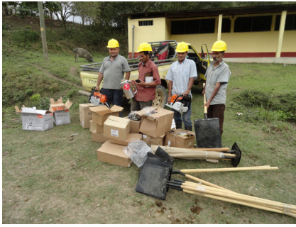
Entrega de herramientas a Cooperativa de San Jose de los Guares, Yoro.

En la actividad “ejecución del plan de manejo” se dotó a cada organización comunitaria de un lote de herramientas forestales con un valor de Lps. 125,000.00 con la finalidad de que la capacitación en protección forestal sea práctica y para que la comunidad realice labores de protección del bosque antes que inicien los aprovechamientos forestales.