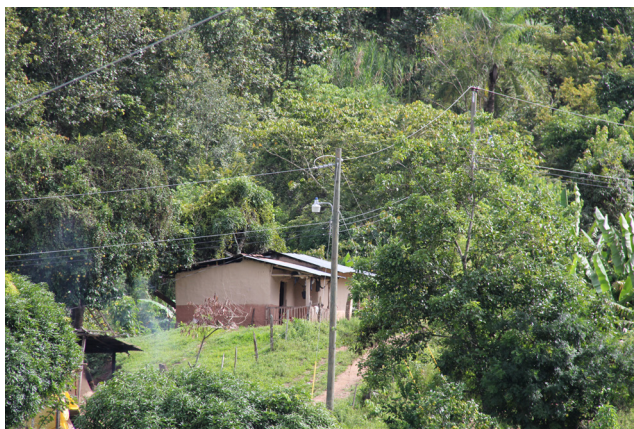
Proyecto de extensión de red eléctrica para proveer de energía a la comunidad de El Encino, Esquipulas del Norte, Olancho.

La implementación de la Forestería Comunitaria, cuyo propósito es beneficiar a toda la comunidad involucrada, contempla en primera instancia generar ingresos a la población que participa en la ejecución de actividades de manejo forestal vía empleo. Además, con las utilidades de la venta de los productos forestales se desarrollan proyectos de infraestructura social (instalación de sistemas de energía renovable, de agua potable, proyectos de saneamiento, salud, educación) e iniciativas productivas (maderable, no maderable, agrícola, pecuario, artesanía). La organización comunitaria puede utilizar su figura legal también para solicitar financiamiento para desarrollar proyectos comunitarios de otras fuentes, como de la municipalidad, ONGs y proyectos de la cooperación internacional.