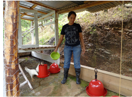
Proyecto de aves para mujeres de la Cooperativa Agua Fría, El Paraíso.

En la actividad de “ejecución de proyectos comunitarios” se puede facilitar un financiamiento de al menos de Lps. 100,000.00 con la finalidad de estimular a la comunidad con la ejecución de un proyecto comunitario antes de obtener ingresos por la venta de madera. En el caso de un grupo de mujeres de la cooperativa de Agua Fría, El Paraíso se financió un proyecto de aves por Lps. 250,000.00