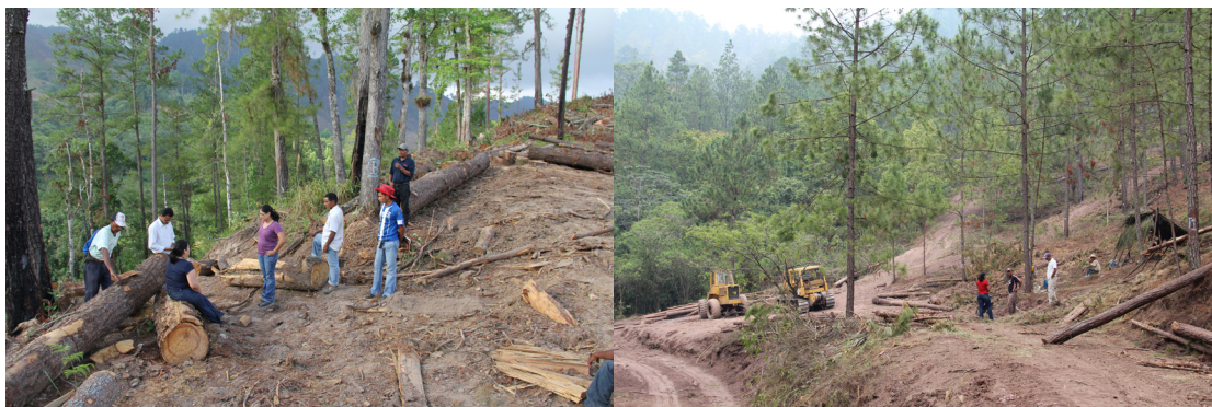
Aprovechamiento forestal en las cooperativas de El Encino, Esquipulas del Norte, Olancho y Marale, Francisco Morazán.

Para la ejecución del Plan de Manejo Forestal, el ICF brinda asistencia técnica y realiza la supervisión de las actividades contempladas en el Plan Operativo Anual. De acuerdo a la normativa, la organización comunitaria tiene la obligación de contratar un técnico forestal, con el visto bueno del ICF, para contar con la asistencia técnica en la administración el Plan Operativo Anual.